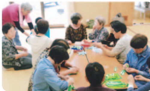
「大収穫祭」に向けての準備作業。裁縫の得意な会員を中心に、作業とおしゃべりが同時並行で進み、楽しい時間となった。