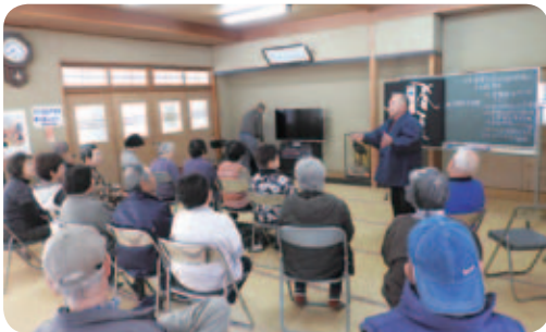
取材日は今年度行った事業を映像で振り返りながら、来年に向けてどんなことをやりたいか会員皆で話し合っていた。