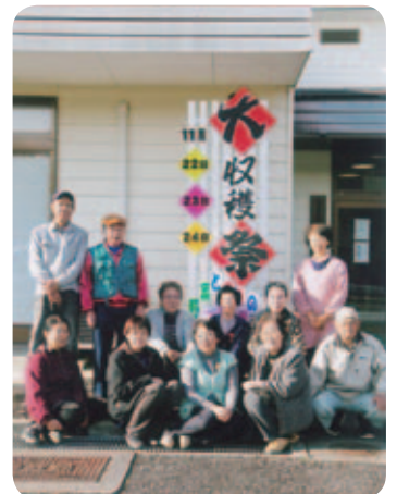
会長自作の看板とともに、会員それぞれの「輝いた顔」が垣間見える。