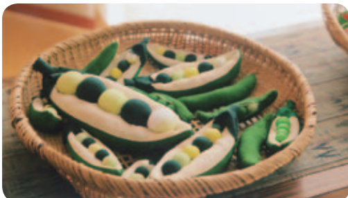
「大収穫祭」で飾った作品のうちのひとつ。大小さまざまな豆が可愛い。